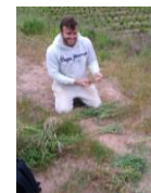
Récolte et pesée / Méthode MERCI