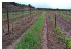
25 avril 2019