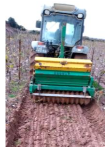
Réalisation du semis